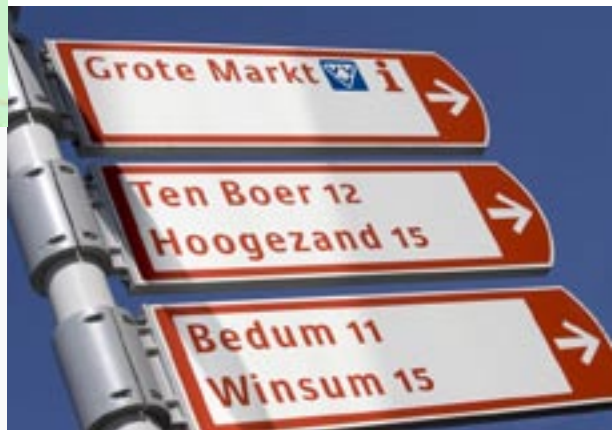
Groningen bewegwijzert vanuit het centrum naar negen grotere plaatsen en de belangrijkste bestemmingen binnen de stad.