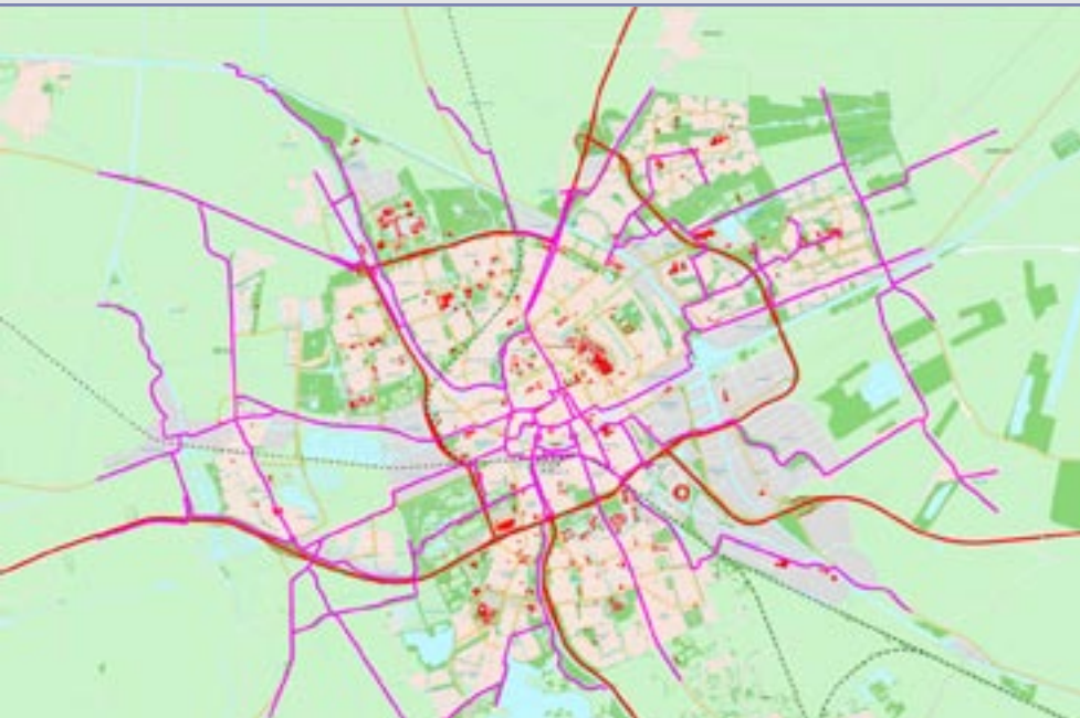
De (paarse) bewegwijzerde fietsroutes van Groningen.