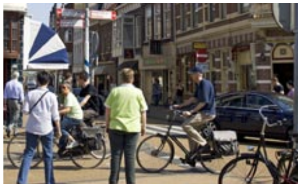
Fietsers op weg naar grotere plaatsen in de omgeving van Groningen worden met de speciale fietsbewegwijzering door de stad heen geloodst.

Er is verder onderscheid gemaakt tussen hoofdroutes en secundaire routes. Op beide routes wordt naar hetzelfde doel verwezen. De hoofdroute leidt de fietser via een rechtstreekse, comfortabele route. Oponthoud wordt zoveel mogelijk vermeden. Bij de secundaire route staat de toeristische aantrekkelijkheid voorop. Dit kan ten koste gaan van de directe lijn en het comfort. De hoofdroutes worden bewegwijzert met de traditionele witte borden met een rode tekst. De secundaire routes zijn herkenbaar aan de witte borden met een groene tekst. Het complete project is inmiddels gerealiseerd door de ANWB. De kosten bedragen ruim 300.000 euro.