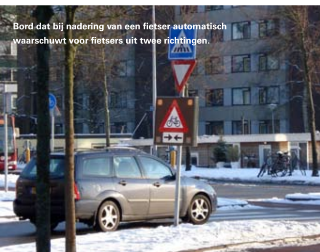
Bord dat bij nadering van een fietser automatisch waarschuwt voor fietsers uit twee richtingen.